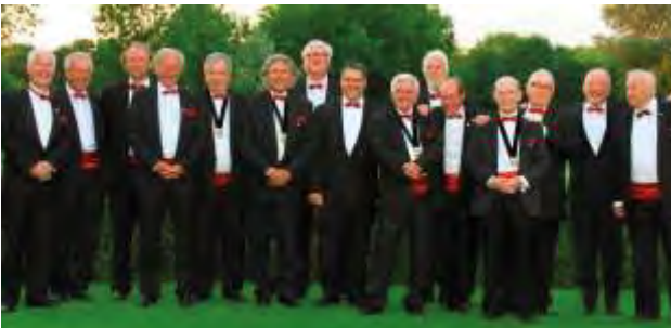
100 e Statutaire vergadering met Jan Jambon in het kasteel van Brasschaat