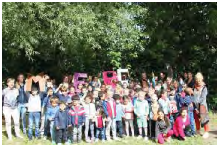
Les enfants du Tremplin nous disent MERCI à Pairi Daïza