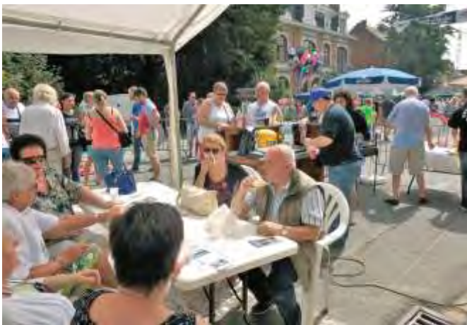
Notre stand à la braderie de Gembloux