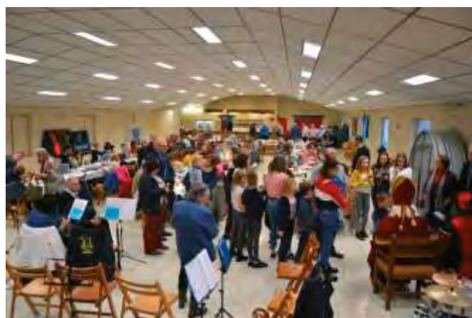
Jumelage Ciney-Dinant et Dinan (Bretagne)