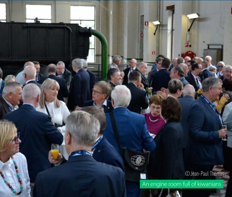
© Jean-Paul Thomas An engine room full of kiwanians