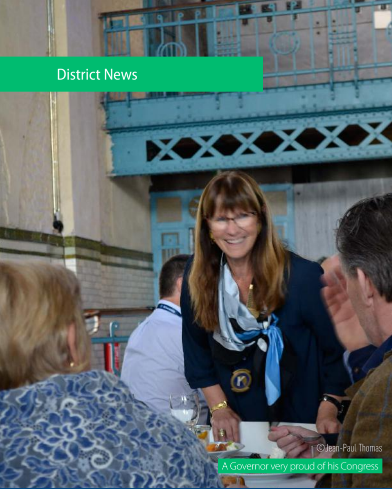
© Jean-Paul Thomas A Governor very proud of his Congress