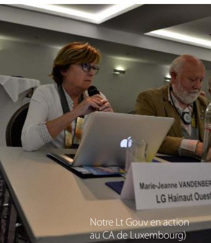
Notre Lt Gouv en action au CA de Luxembourg

Elle a été ponctuée par un départ fulgurant.