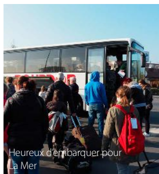
Heureux d'embarquer pour La Mer

N'oublions pas le quartier St-Piat. Du lait a été offert