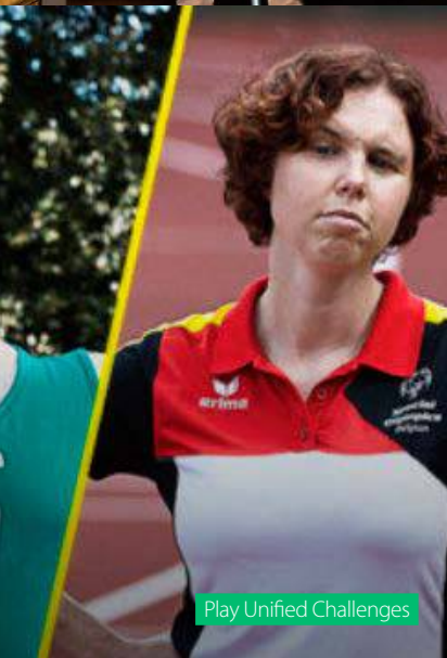
Play Unified Challenges