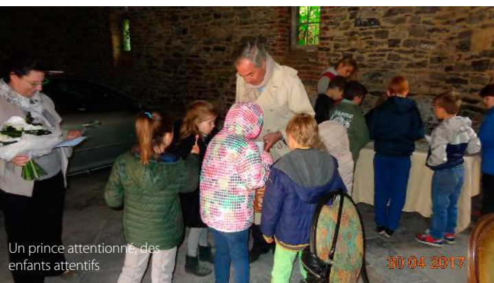
Un prince attentionné, des enfants attentifs

En Mai, les membres ont participé à une journée pédagogique en accompagnant un groupe d'enfants au château d'Antoing. La présence active du propriétaire, le Prince de Ligne, y apporta une dimension supplémentaire appréciée de tous.