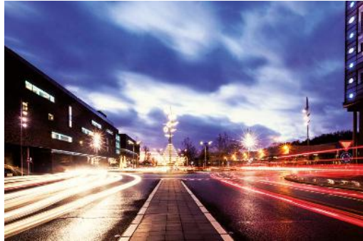
Carbon Hotel C-Mine Cultuurcentrum