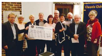
Réunion statutaire du 15/2/2017 : remise des chèques

Grâce à cette soirée, et aux excellents résultats de nos autres actions et ventes, nous avons pu distribuer la considérable somme de 4.355€ à toutes les actions sociales que nous aidons et envoyer 8 enfants à la mer cette année !