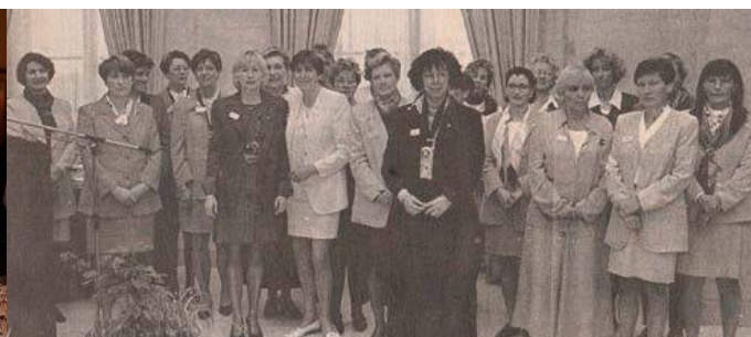
20 ans séparent ces deux photos