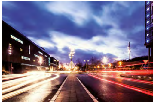
Carbon Hotel C-Mine Cultuurcentrum