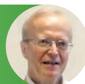
Herman Eekhout Lt-Gouverneur VI-Brabant West