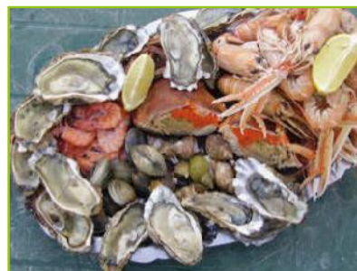
Kiwanis Vielsalm Soirée Fruits de mer 27 février 2016