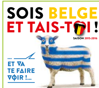
Kiwanis Florenville Centre Culturel de Libramont 06 mars 2016