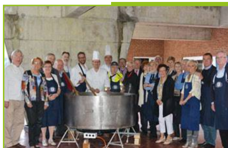
Kiwanis Bastogne Goulasch 23 avril 2016