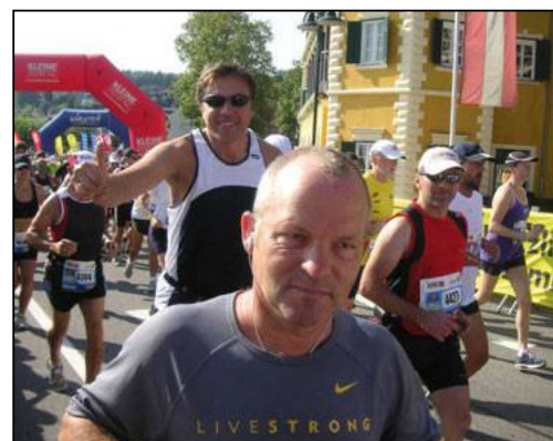
A dynamic President : running