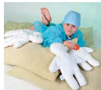
The Dolls also in DIPF