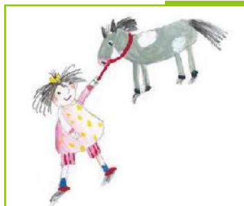
Kiwanis Uelzechtall - Mersch «Thérapie assistée par l'animal» sur le site du SOS Village d'Enfants à Mersch.

Et pour les clubs, c'est le bon moment pour commencer à semer les actions sociales de l'année.