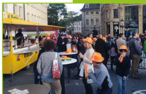
Kiwanis Mamerdall Marathon ING 28 mai 2016