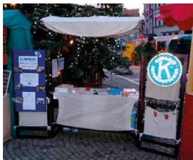
The Eliminate Stand

On peut mettre en exergue le KC Kosice qui s'était engagé, à la Convention de Bergen, à être «Model Club» et est devenu aujourd'hui le KC Kosice Gold Club.