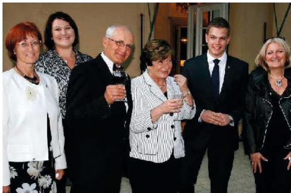
The Czech Republic and Slovak Republic board

De Kiwanispop is ons vlaggenschip. Het is ook daarom dat alle clubs van ons District deze verjaardag gevierd hebben op 23 november 2015. Op die dag hebben bijna alle clubs van ons District Kiwanispoppen overhandigd aan gehospitaliseerde kinderen en werd het evenement gepresenteerd in de Tsjechische en Slowaakse media (kranten en tv).