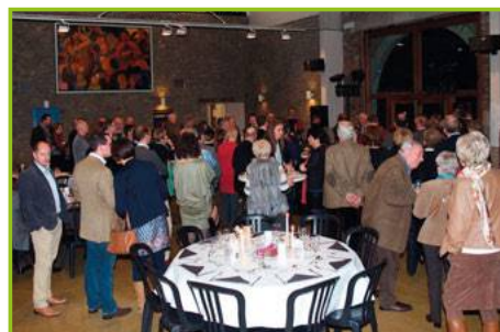
Kiwanis Durbuy Soirée Choucroute 23 janvier 2016