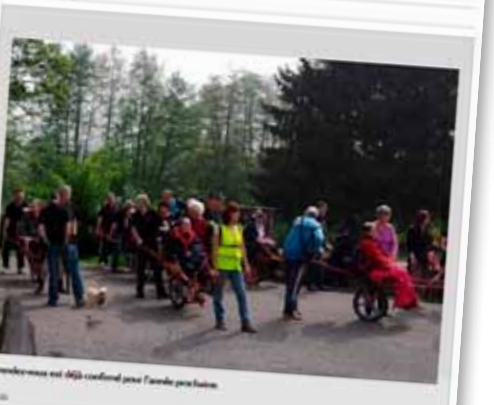
Le rendez-vous est déjà confirmé pour l'année prochaine.

Les membres du Kiwanis de Sambreville se sont à nouveau mobilisés pour venir en aide aux membres du CIDMAT, le Centre d'identification et de documentation des matériels.