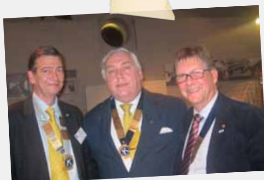
Present & Future