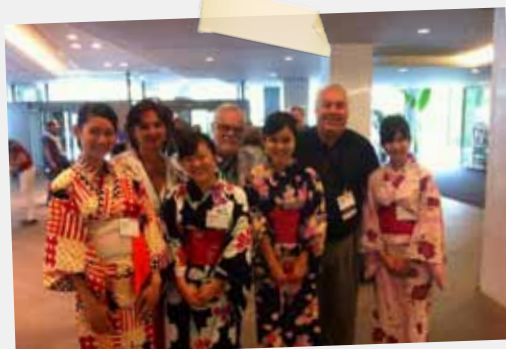
KI Convention - Tokyo