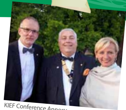
KIEF Conference Annecy