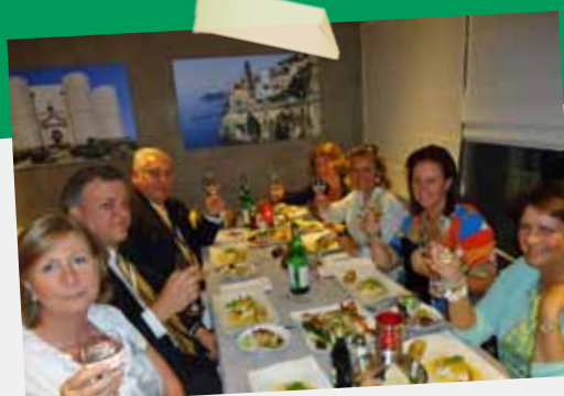
KC HOEYLAERT-ZONIENWOUD (in op.)