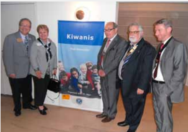
Divisie Vlaams Brabant Oost - KC Oud Heverlee