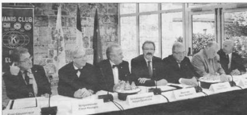
Beim Festakt im Saal des Ministeriums der DG.

Eine alljährliche Großaktion steht für die Kiwaner in Kürze an: das Zusammenstellen, Packen, Ausliefern der Nikolaustüten. „Im vergangenen Jahr wurden 6000 Nikolaustüten und 300 Geschenkpakete bestellt und ein Erlös erwirtschaftet, der inzwischen zwei Drittel unserer sozialen Werke finanziert“, heißt es beim Kiwanis-Club Eupen.