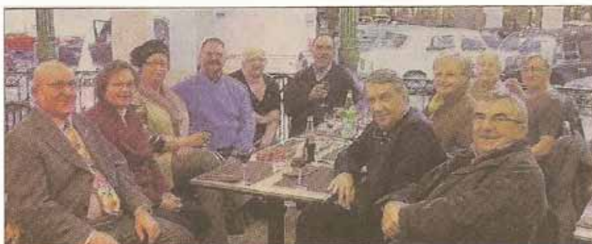
Une petite pause bien méritée, au sein du musée Peugeot.

Un groupe belge wallon du club Kiwanis « Ottignies cœur de ville » est venu, le week-end dernier, visiter le marché de Noël de Montbéliard.