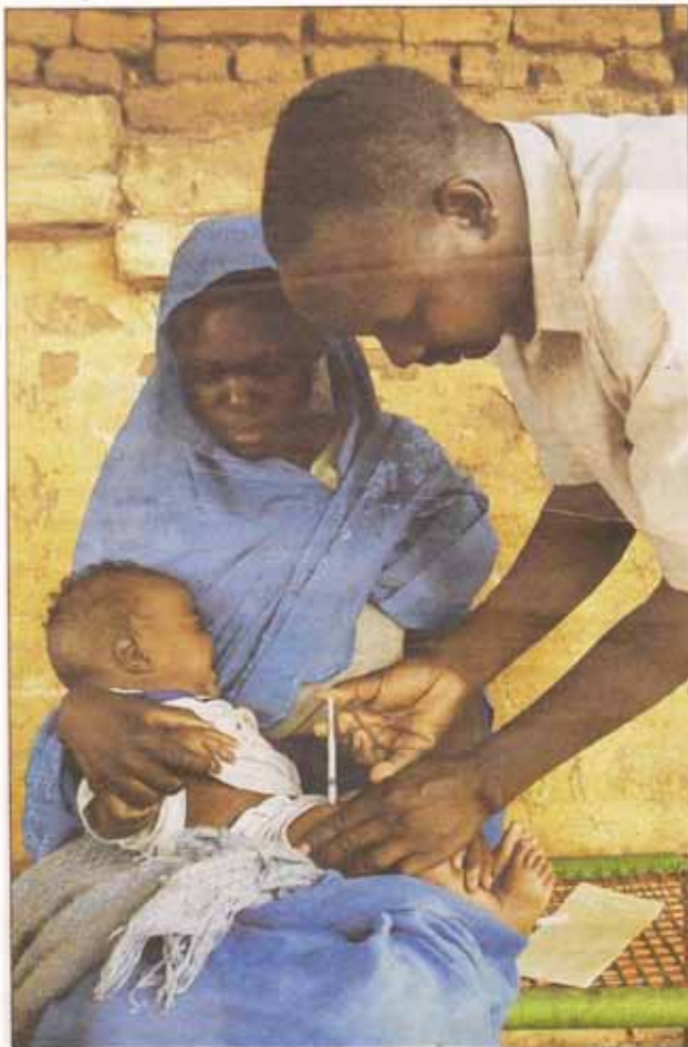
Gemeinsam mit Unicef will der Service-Klub Kiwanis International bis 2015 die Tetanus-Erkrankung bei Müttern und Neugeborenen ausmerzen.

»Die Frauen gebären auf dem nackten Boden und kommen mit den Tetanus-Bakterien im Erdreich in Kontakt. Ebenso der Säugling. Die Nabelschnur wird mit einem nicht sterilen Instrument abgetrennt.« Unter qualvollen Krämpfen tritt der Tod wenige