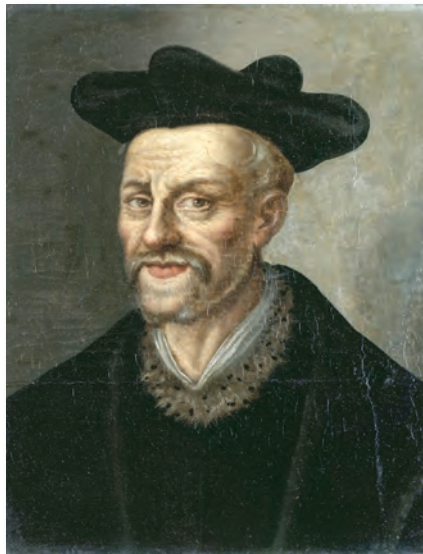
François Rabelais, humaniste français du XVI e siècle

La Renaissance a permis l'expansion de la liberté de pensée et du scepticisme. On peut alors citer par exemple Léonard de Vinci, qui indiquait que l'explication venait de l'expérimentation, et opposait ses arguments aux autorités religieuses.