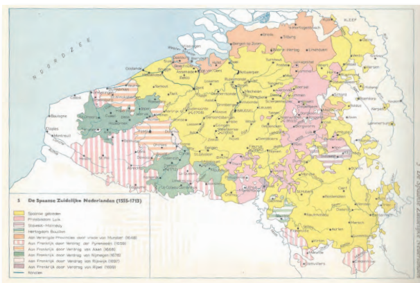
De Spaanse Nederlanden