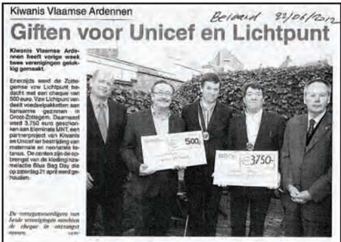
Kiwanis Vlaamse Ardennen Giften voor Unicef en Lichtpunt Beiaard 21/06/2012