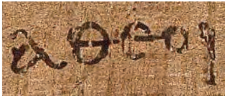
« atheoi » dans la lettre aux Éphésiens (2,12) attribuée à Paul de Tarse - Papyrus 46 du début du III e siècle.

L'athéisme peut être considéré comme une attitude ou une doctrine qui affirme l'inexistence de quelque dieu ou divinité ou entité surnaturelle que ce soit. Donc l'athéisme est une croyance au même titre que les autres que je vous ai déjà présentées. Au contraire du déisme, du théisme et du panthéisme qui soutiennent ces existences, ou à l'agnosticisme qui est, lui, la doctrine qui considère que l'absolu est inaccessible à l'esprit humain et qui préconise le refus de toute solution définitive aux problèmes métaphysiques. C'est une position philosophique que l'on peut formuler ainsi : dans l'Univers et dans l'état actuel des sciences et des connaissances, il n'existe rien qui ressemble de près ou de loin à ce que les croyants appellent Dieu. Mais cette philosophie – et c'est vraiment fondamental – ne nie nullement la possibilité qu'un jour, proche ou éloigné, un élément permettra de le prouver.