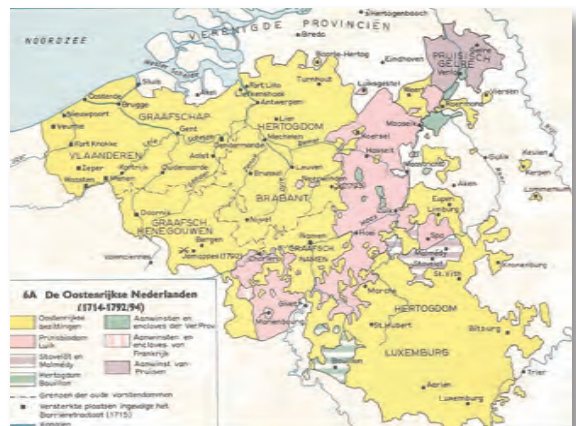
De Oostenrijkse Nederlanden