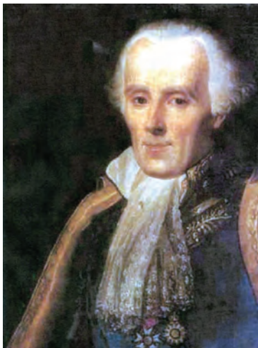
Pierre-Simon de Laplace (1749-1827), mathématicien, astronome et physicien. Il est le symbole de l'athéisme scientifique

Les progrès de la science, entre le 16e et le 18e siècle, soit de Copernic aux Lumières, permettent d'expliquer l'univers de manière de plus en plus satisfaisante sans recours à aucun dieu de type biblique, comme le montre l'échange célèbre 2 :