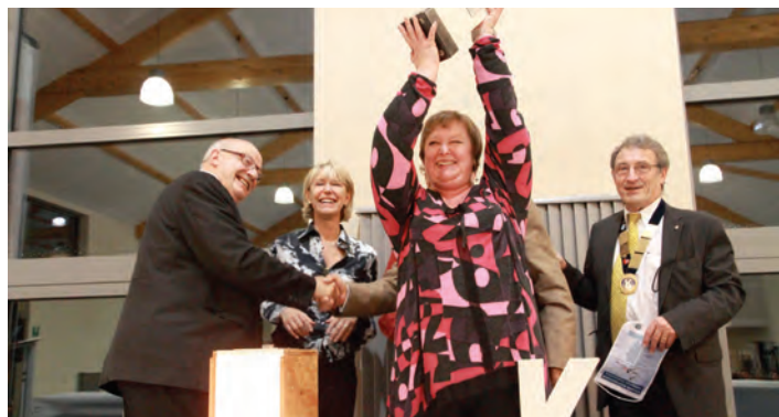
La remise du Challenge aux « Cerveaux Lents ». Une équipe non kiwanienne pour qui c'était une première.