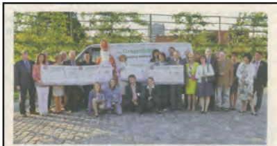
ROESELARE - Kiwanis speelt voor Sinterklaas Met cheques voor vier De Maakt, van De Graanckel, project De Stapesteen, van de Zonnebloem- blaadjes en de bewaakings van het VTI maakten de leden van afdeling Kiwanis Roeselare 1 heel wat verenigingen gelukkig. De leden verzamelden het geschonken geld door de verkoop van Jules Dierstogeloches.