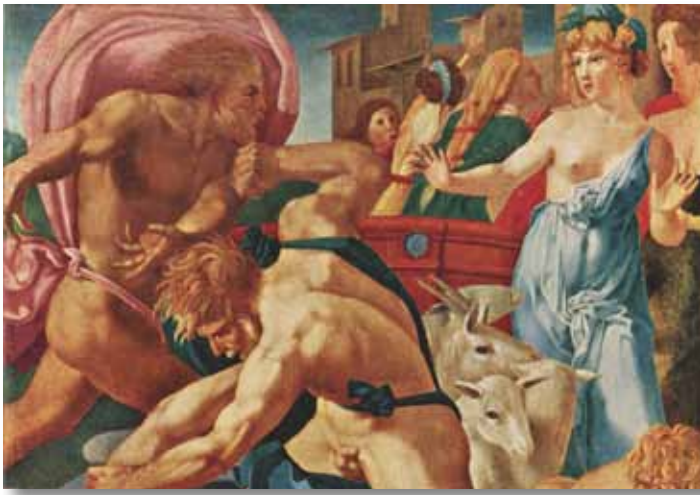
Moïse défend les filles de Jéricho par Rosso Fiorentino, Iacopo (1494 - 1540) dit Rosso Fiorentino à cause de la couleur de ses cheveux, est un peintre italien de la Renaissance tardive.

Cette religion se fonde sur le culte du Dieu d'Abraham, d'Isaac et de Jacob, au Nom ineffable, qu'elle conçoit comme une Essence éternelle (YHWH), qui détient tous les pouvoirs (Elohim), transcendant Seigneur des seigneurs (Adonai) qu'elle considère Un et Unique et qu'elle qualifie ainsi : omnipotent, omniscient, juste et miséricordieux.