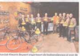
Serviceclub Kiwanis Bepart organiseert de badeendjesrace al voor de derde keer.

De organisatie bereikt dit jaar de laatste keer van de laatste van de Dender. Dit jaar begint de wedstrijd op een vrolijk en feestelijk plaatsje, gaat het steeds beter. Met in de derde keer dat Kiwanis Bepart het evenement organiseert.