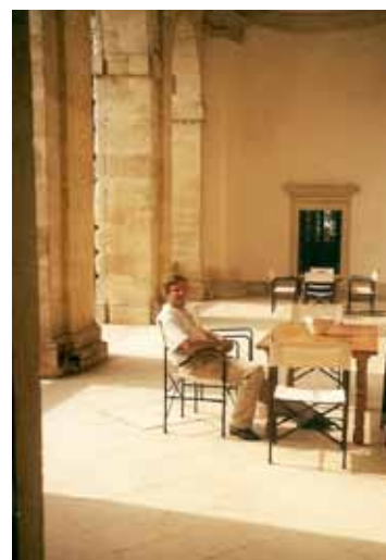
Op het terras bij Pisani