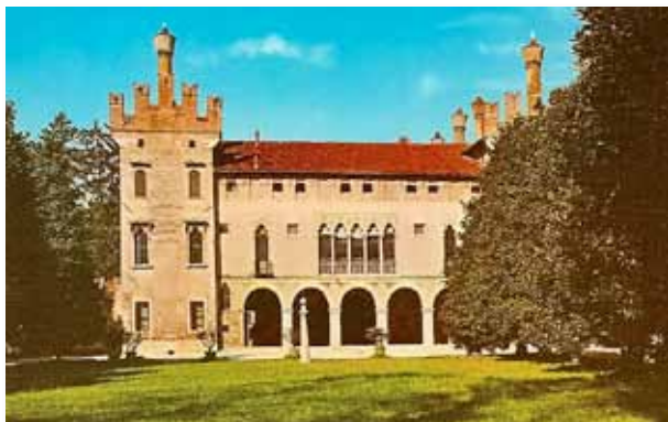
Villa da Porta Colleoni.

De villa's moesten immers tegelijk dienen tot 'nut' als tot 'troost', tot 'utilità e consolazione'. De rijk geworden handelaars wilden een beetje af van het risicovolle handelsleven, en hielden zich nu liever bezig met de landbouw op hun nieuwe domeinen. En dit had zijn invloed op de architectuur van hun woningen. In de bijgebouwen moest er plaats zijn voor dieren, voertuigen en oogst. De zijvleugels werden 'barchesse' genoemd naar de plaatsen waar in Venetië de schepen (barche) ondergebracht werden. Het centrale gedeelte moest mooi versierd zijn om in te leven. Het moest hun ook de gelegenheid geven om te genieten van het buitenleven als contrast met het hectische gedoe in de stad. Een laatste aspect is het feit dat het gebouw prestige moest uitstralen. Het moest het visitekaartje zijn van die rijke renteniers. De architecturale vormen van de klassieke Oudheid waren hiervoor natuurlijk ideaal, en hiervoor waren de opdrachtgevers bij Palladio aan het juiste adres. Het middendeel van de villa Emo in Fanzolo di Veduggio heeft een loggia met vier Toscaanse zuilen tot aan het dak, die een