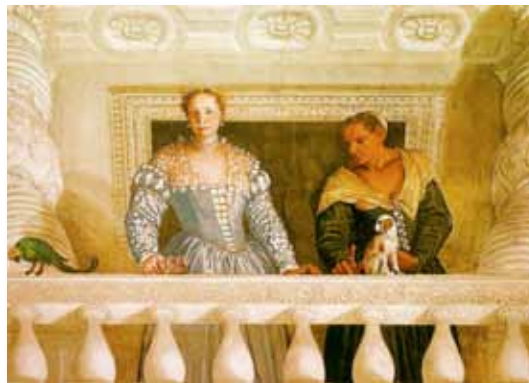
Trompe l'œil van Veronese