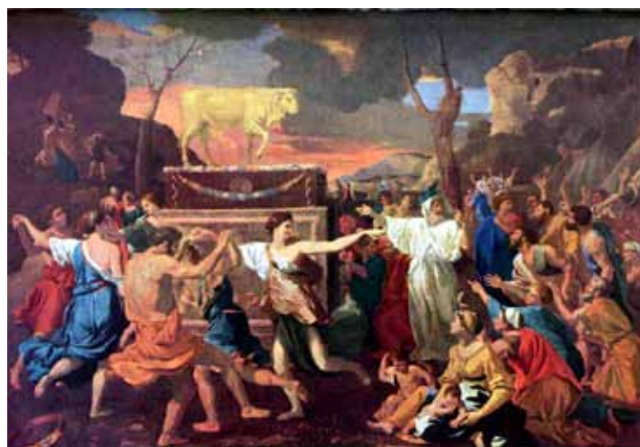
L'adoration du Veau d'or, Nicolas Poussin – (1594 -1665)

Une synagogue particulièrement belle se trouve à Tolède, témoin de « l'âge d'or espagnol »; elle a été construite en 1203, très influencée par l'architecture arabe. Elle abrite actuellement un musée.