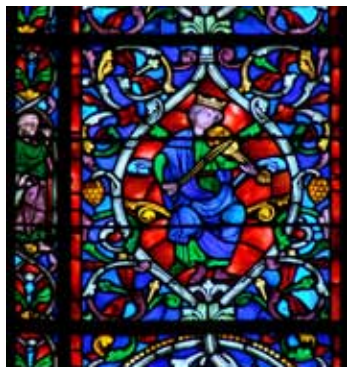
Le Roi David vitrail du XIXe siècle de la Cathédrale Notre-Dame de Reims

Le judaïsme est fondé sur l'enseignement de Moïse. Ce dernier est né en Egypte vers 1200 avant J-C. Sa vie de prophète et de rassembleur du peuple juif est relatée dans l'Exode et le Deutéronome de l'Ancien Testament.