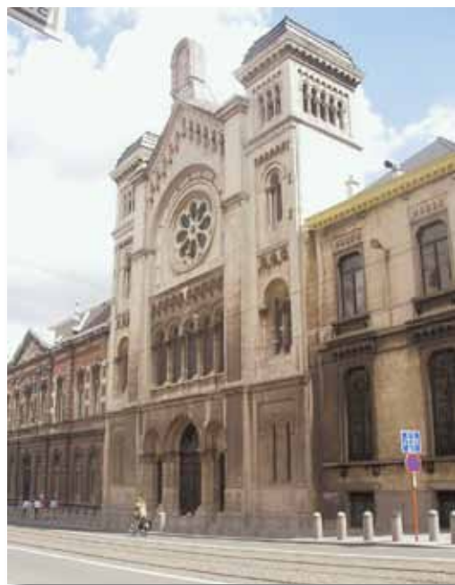
La synagogue de Bruxelles

Les juifs, en principe, prient le matin, l'après-midi et le soir, en groupe d'au moins dix hommes, la tête couverte avec un chapeau ou une kippah (calotte).