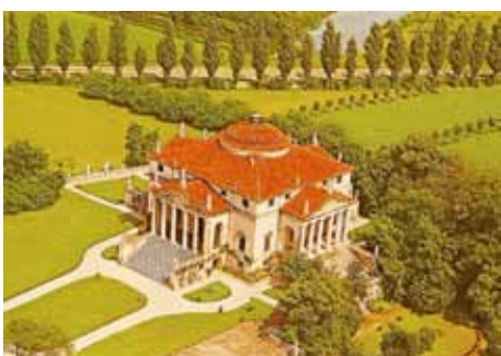
Villa la Rotonda