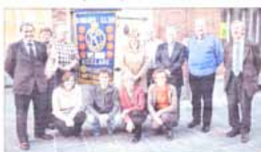
De verschillende partners zijn klaar voor een passieconcert komende zaterdag in de Sint-Michielskerk.

Het concert begint om 19.30 uur. Tickets in elk kosten 17 euro, ook betaal je 19 euro. Achteraf is er nog een uitgebreide receptie. Tickets via www.kiwaniis.be .