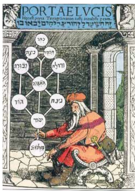
Arbre de vie médiéval

La Kabbale –de kabbala, qui veut dire « tradition »– est l'aspect ésotérique du judaïsme, au même titre que le Soufisme pour l'Islam et la Gnose pour le Christianisme. Elle cherche essentiellement à réinterpréter les données de la révélation en vue d'atteindre des réalités supérieures.