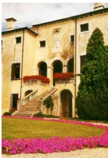
Villa Godi Valmarana