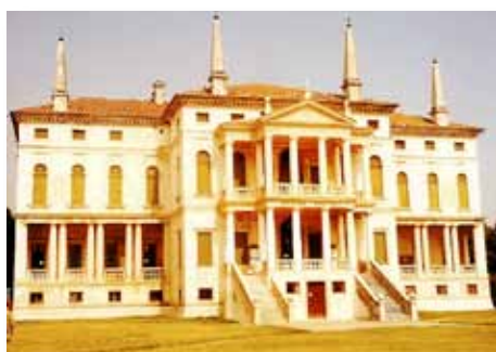
Grotere en grotere formaten