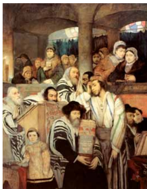
Yom Kippour, le jour le plus saint et le plus important du calendrier juif selon certains, les Juifs jeûnent et prient afin d'obtenir le pardon pour leurs péchés, individuels ou communautaires -- Tableau de 1878 de Maurycy Gottlieb

Ensuite, l'Alliance entre Dieu et le peuple juif conclue sur le Mont Sinaï par Moïse. Le peuple doit Lui obéir et en retour, Dieu le reconnaît pour Son peuple particulier sur lequel il veille.