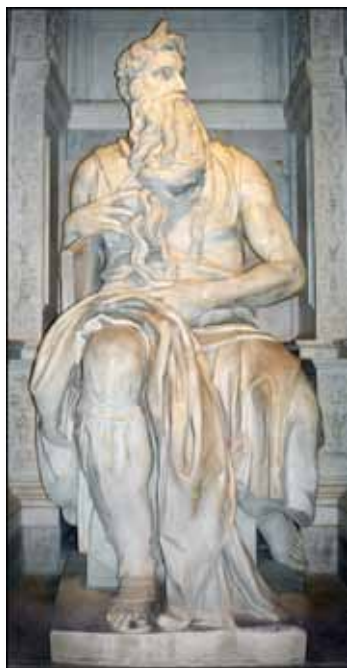
Détail du Moïse de Michel-Ange