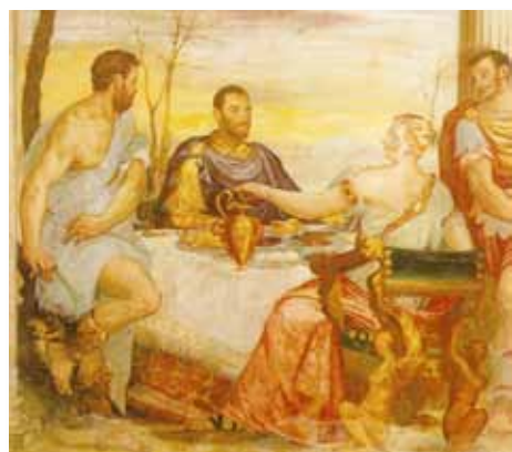
Aan tafel met Cleopatra.