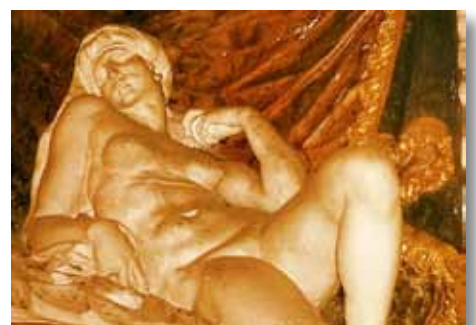
Nog eens Aurora