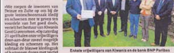
Enkele vrijwilligers van Kiwanis en de bank BNP Paribas die zaterdag kledij gaan ophalen.

Serviceclub Kiwanis Gent Gravensteen in Deinze en Zulte haalt op zaterdag 21 april kledij op voor het goede doel. De opbrengst gaat naar het Dienstverleningscentrum Heilig Hart in Bachtel-Maria-Leerne.