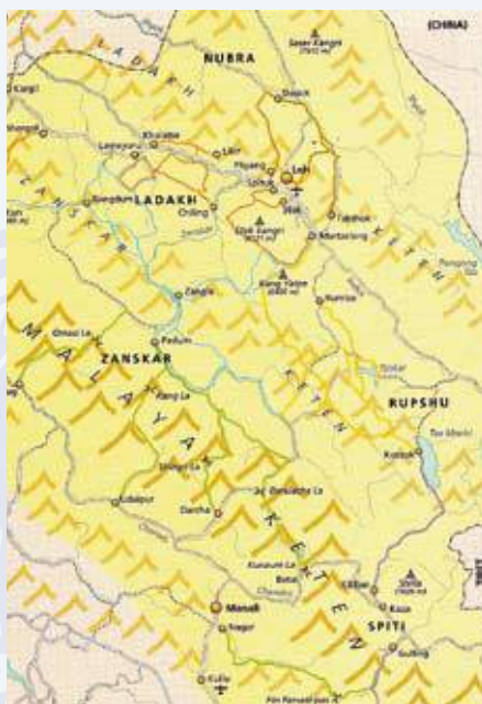
Kaart van Ladakh

jaar oud. De gebedsruimten zijn bedekt met kleurige, wel wat afgebleekte schilderijen, maar zijn aardedonker, zodat foto-opnames niet mogelijk zijn. Aan de overkant van de rivier ligt het klooster van Ky. Het bestaat uit een echte piramide van witte op elkaar gestapelde bouwsels. Er is juist een gebedsdienst bezig in de centrale tempel. De overheersende kleur is duidelijk. De monniken met hun rode gewaden zitten op rode lage banken met rode kussens tussen rode pilaren. Ze zitten mooi op twee rijen eentonige gebeden te reciteren. Sommigen slaan af en toe op grote groene platte trommels, anderen blazen op fluiten, de grootste wel twee meter lang. De dienst loopt juist ten einde, want na enkele minuten houdt iedereen