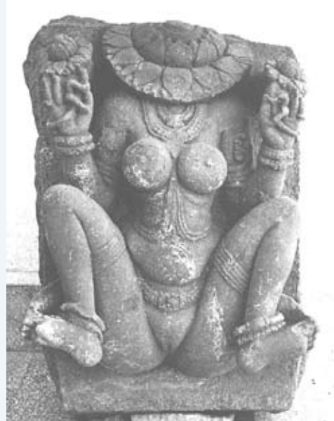
Une sculpture en grès de Lajja Gauri (Circa 650 de notre ère - Badami Museum, Inde). Lajja Gauri est une déesse associée à l'abondance et de fertilité. Elle se présente avec la tête sous forme de corolle de fleur, nue, accroupie les cuisse écartées.

Vishnou et des divinités féminines et l'affirmation de la « dévotion » – expression religieuse d'adoration des divinités très répandues en Inde au Moyen Âge. L'invasion musulmane date de la fin du Xe siècle. La domination coloniale britannique en Inde se terminera par l'indépendance et la partition du sous-continent entre le Pakistan et l'Union indienne (1757-1947). La victoire religieuse de la civilisation de l'Indus sur la foi aryenne ritualiste se dessine.