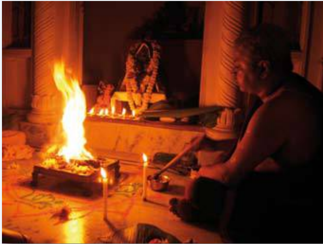
Entretien du feu.