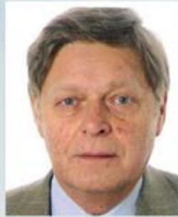
Jean Guillaume Deux Luxembourg